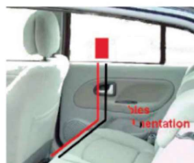
Kablerne trækkes så transponderen nemt kan tilsluttes strøm.

På youtube.com kan du finde flere videoer, søg på "balise chronopist" eller kik på chronopist.com (hjemmeside på fransk)